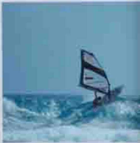
Windsurf Familia Taita, jinetes locos de 15 años, trascurre sus días en el agua y foguea su arte a lo largo de las generaciones.

Cuando en las islas Canarias llega el invierno, los días se hacen más cortos, el mar empieza a perder preciosos grados de temperatura y los bucnos días de windsurfing son cada vez más escasos, nada mejor que cruzar el charco a la costa del aliso que sopla en el archipiélago de las Pequeñas Antillas más al sur del Trópico de Cáncer.