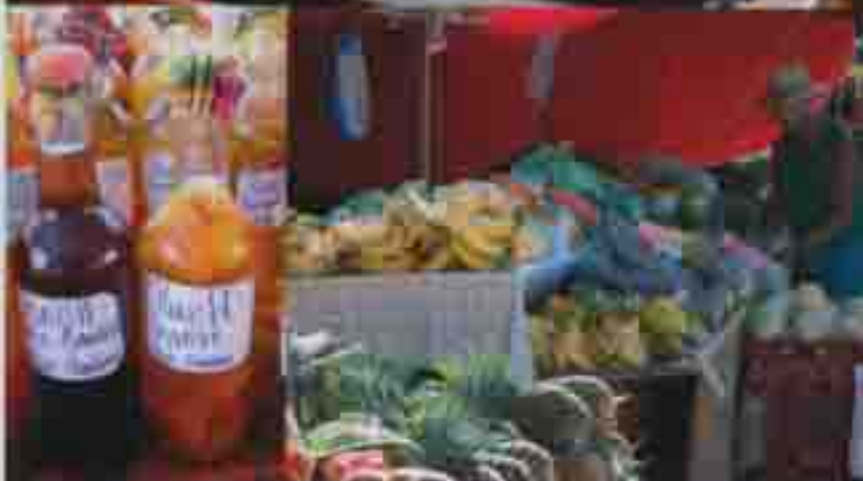
La fruta es buena siempre en Francia, aunque por la proximidad a América la oferta varía de vez en cuando.