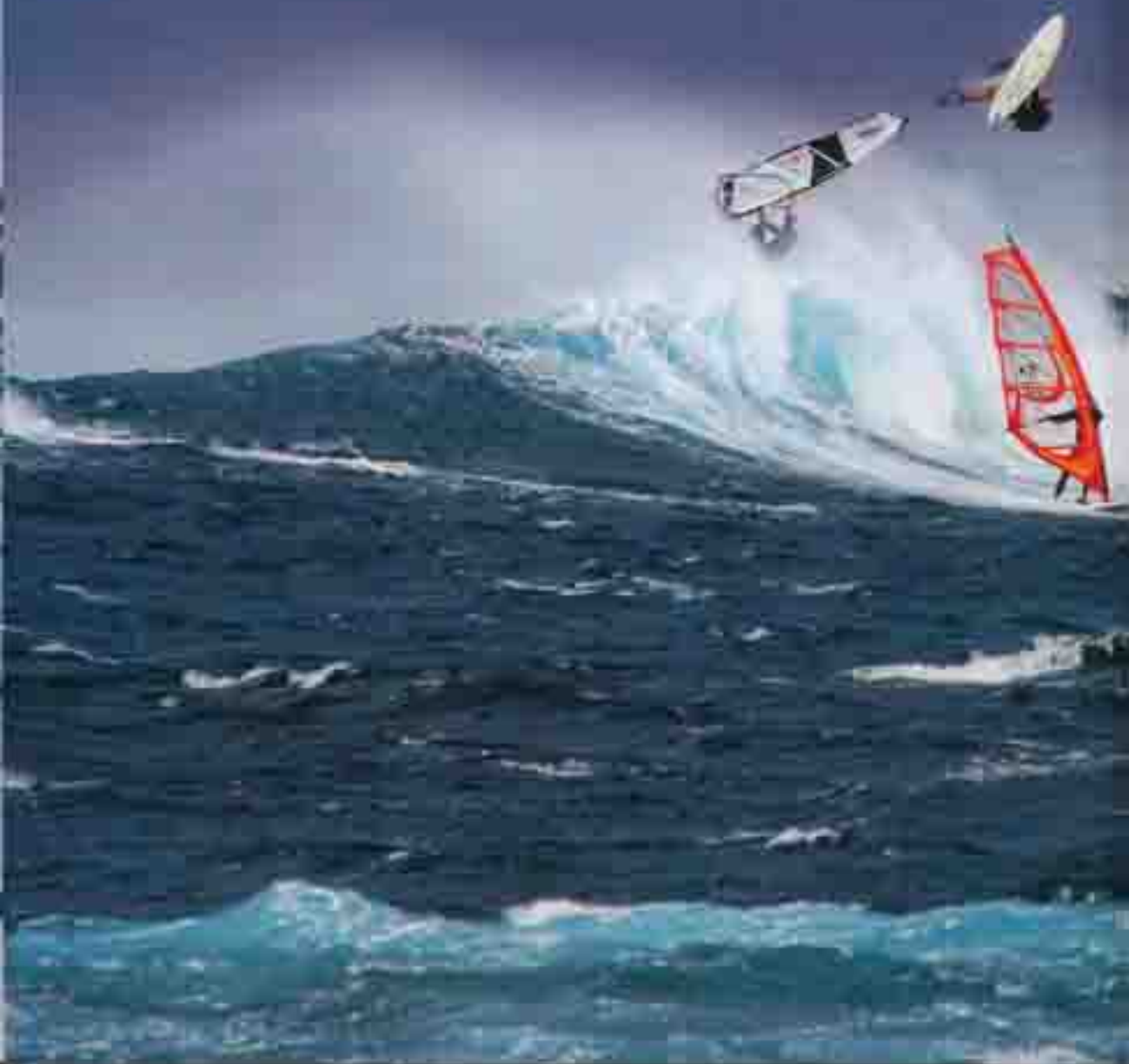
Rider: Alex Munoz/Diego Krumholz Location: Fuerteventura