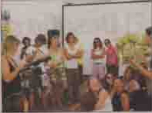
Reclutamiento de las 48 windsurfistas que participarán en el Training Camp Volkswagen Comercial en El Médano.